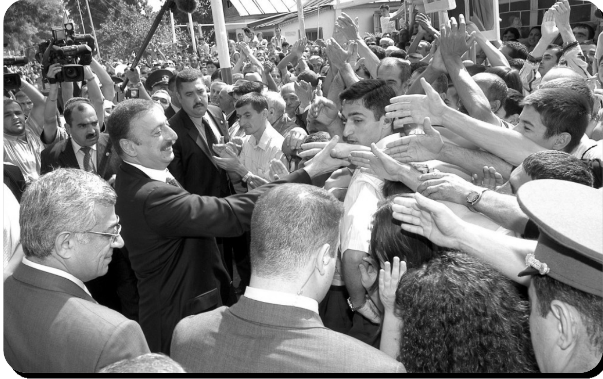
2003-cü ilin 15 oktyabr tarixində Cənab İlham Əliyevin Prezident seçilməsi...

Bəli, dahi lider Heydər Əliyev bildirdi ki, liderlik bacarığı elə siyasətçilərə məxsusdur ki, onlar xalqın, dövlətin milli maraqlarını qorumaqla yanaşı, həm də öz ölkəsini davamlı şəkildə inkişaf etdirir, yorulmadan irəliləyə doğru apara bilir. Bu mənada Azərbaycan xalqı da çox xoşbəxtədir ki, ölkəmizə uzun müddət dünya siyasətinin fenomenini, bütün heyatını canından artıq sevdiyi doğma xalqına həsr etmiş Heydər Əliyev kimi dahi şəxsiyyət rəhbərlik etmişdir. Məhz ona öz qədər inandığını və Azərbaycanın gələcəyinə böyük ümidlər bəslədiyinin nəticələri bu gün bütün dünyaya görünür. Və bu gün ümummilli liderimiz Heydər Əliyevin ideyaları, müəyyənləşdirdiyi prioritetlər, dövlətçiliyimizin hərtərəfli inkişaf konsepsiyası onun layiqli davamçısı, möhtərəm Prezident İlham Əliyev tərəfindən uğurla davam etdirilir.