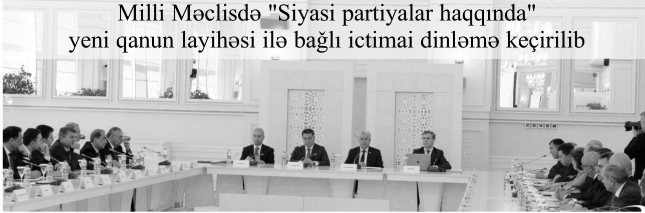
Milli Məclisdə "Siyasi partiyalar haqqında" yeni qanun layihəsi ilə bağlı ictimai dinləmə keçirilib