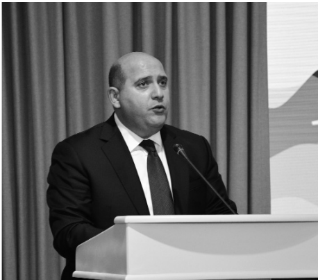
Əvvəli Səh. 5

S.Babayev qeyd edib ki, işğaldan azad edilmiş torpaqların sosial-iqtisadi sistemə effektiv reintegrasiyası təmin edilir. Həmin ərazilərdə mərhələli şəkildə, prioritetləşdirilməklə, rəqəmsal texnologiyaların geniş tətbiqi ilə müasir sosial infrastrukturunun yaradılması, dayanıqlı məskunlaşmanın təmin edilməsi nəzərdə tutulur. Bu baxımdan, 2022-2026-cı illərdə yeni sosial-iqtisadi inkişaf modeli ölkəmizdə çoxsahəli inkişafın yeni keyfiyyət səviyyəsini müəyyən edəcək. Eləcə də bu ərazilərdə Böyük Qayıdış məqsədinin reallaşdırılması üçün əhalinin dayanıqlı məskunlaşması təmin olunacaq. Bundan əlavə, işğaldan azad olunmuş ərazilərə qayıdan vətəndaşlarımızı pensiya, müavinət, təqaüd və digər sosial ödənişlərin proaktiv təyinatı, habelə ehtiyacı olan ailələrə ünvanlı dövlət sosial yardımının təyinatı üçün lazımı tədbirlər həyata keçiriləcək.