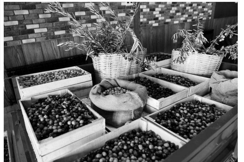
Prezident İlham Əliyev Zirə qəsəbəsində zeytun yağı və süfrəlik zeytun məhsullarının emalı zavodunun açılışında iştirak edib