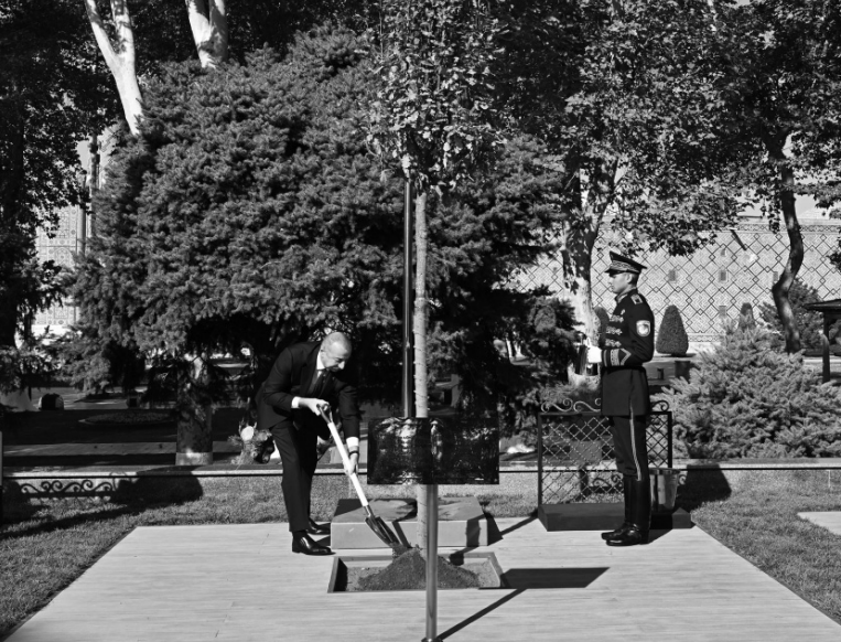
Zirvə Görüşündə iştirak edən dövlət və hökumət başçıları Səmərqəndin "Registan" meydanında ağac əkiblər

Prezident Şavkat Mirziyoyev təşkilata üzv və müşahidəçi ölkələrdə ağacəkmə aksiyalarının keçirilməsinin qlobal problemlərdən olan ana təbiətin qorunub saxlanmasına verilən önəmin göstəricisi olduğunu bildirib. Ətraf mühitin mühafizəsi ilə bağlı Azərbaycanda uzun illərdir "Yaşıl marafon" proqramı əsasında ağacəkmə aksiyalarının keçirildiyini qeyd edən Prezident Şavkat Mirziyoyev belə təşəbbüslərin təşkilatı üzv və müşahidəçi ölkələrdə də davamlı reallaşdırıldığını, qardaş Türkiyədə hər il noyabrın 11-nin Milli Yaşıllaşdırma Günü olduğunu bildirib. Sonra dövlət başçıları "Registan" meydanında ağac əkiblər.