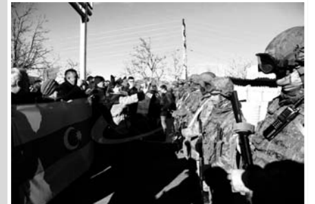
EKSPERT RƏYİ+ AKTUAL