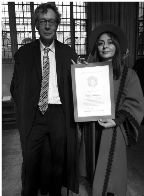
rə, Azərbaycan Prezidenti İlham Əliyevin Sərəncamı ilə "Şərəf" ordeni ilə təltif edilib.