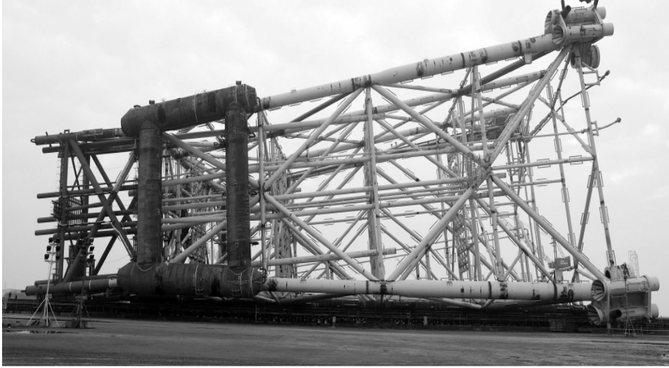
Əvvəli Səh. 2

Prezident İlham Əliyev "Azəri-Mərkəzi-Şərqi" platformasının dayaq blokunun dənizə yola salınması mərasimində iştirak edib