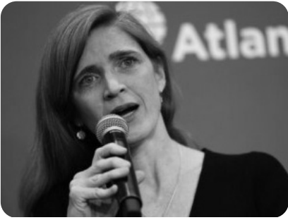
Bu, həmin Samanta Pauerdir...

Məlum olub ki, USAİD-in rəhbəri Samanta Pauer özünün twitter səhifəsində Azərbaycan ekoloqlarının və QHT fəalları guya Laçın yolunu "bağlamalarını" hədəfə alan ittiham xarakterli fikirlərini yazıb, eləcə də sözügedən istiqamətin açılmasını tələb edib. Halbuki, bu yol məhz Rusiya sülhməramlıları kontingenti (RSK) tərəfindən bağlanılıb və bu barədə rəsmi Bakının da bəyanatı var.