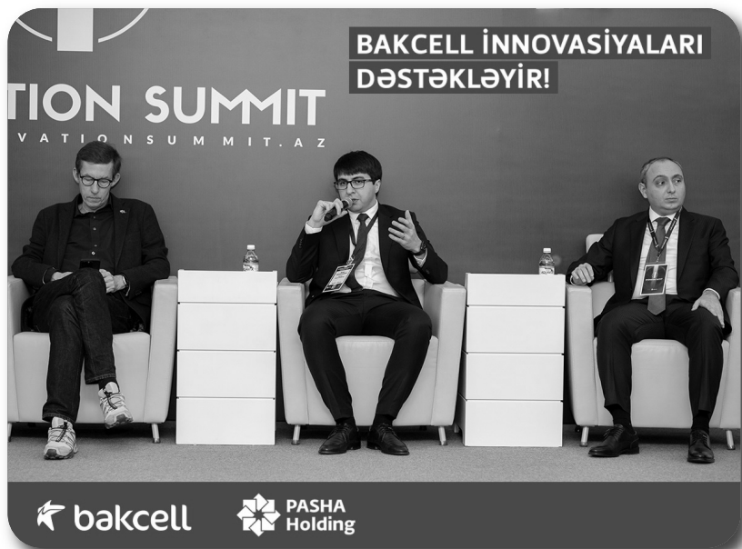
bakcell PASHA Holding

Qeyd edək ki, Bakcell şirkəti artıq ikinci ildir ki "PAŞA Holding" in təşkilatçılığı ilə keçirilən İllik İnnovasiya Sammitinin baş sponsorudur.