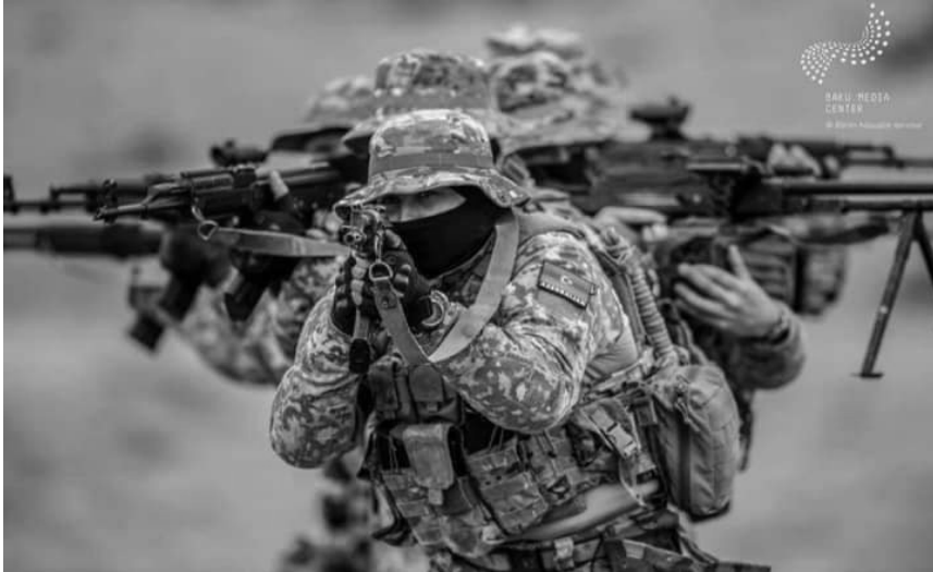
Əvvəli Səh. 12

Onlara öz ailələri ilə mitinqə gəlmələri üçün mülki geyimlər verilib. Ancaq kadrlardan da görüldüyü kimi, onların heç də hamısı mülki geyimlə manipulyasiya edə bilməyiblər. Bəziləri kadrlara məhz hərbi uniformalarda görünüb.