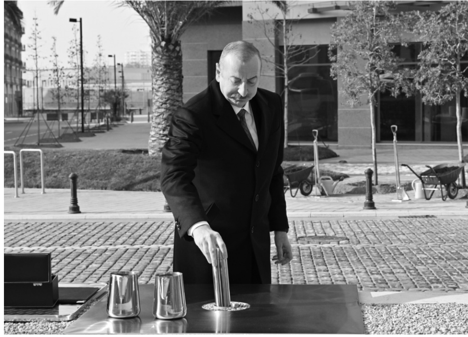
Prezident İlham Əliyev görülən işlərlə tanış olub, Qarabağ Atları Kompleksinin təməlini qoyub