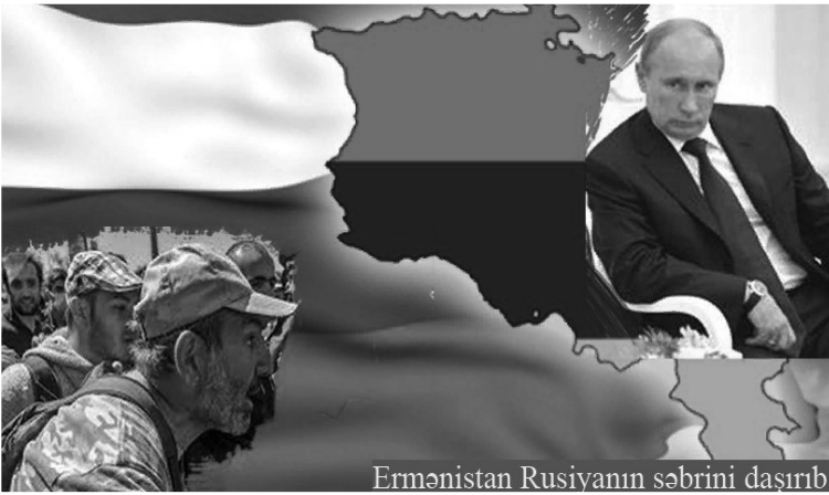
Ermənistan Rusiyanın səbrini daşıyır

və KTMT ilə münaqişənin genişləndirilməsinə gedəcəyinə az adam inanırdı.