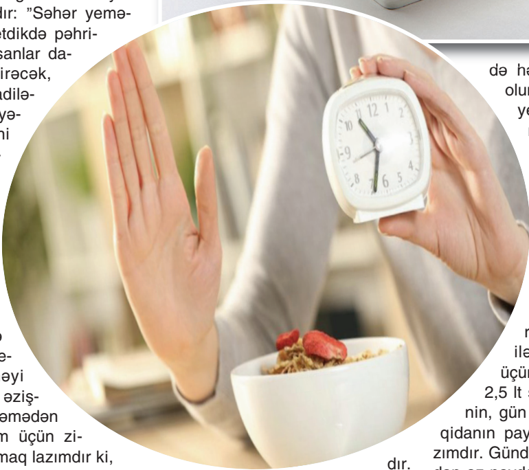
Beləliklə, həm daha az yemək yeyəcək, həm

də həzm fermentləri ifraz olunacaq. Sürətli yemək yeyəndə həzm sisteminin iş prosesi zəifləyir, bu da çəkinin artmasına səbəb olur”.