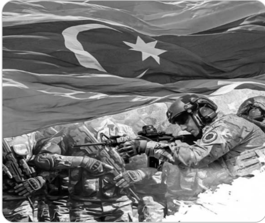
Hakimiyyət rəsmilərinin Azərbaycana qarşı sərəsəmləmələri davam edir...

Beləliklə, Ermənistan parlamentinin vitse-spikeri iddia edir ki, guya bu ölkənin Qarabağda silahlı qüvvələri yoxdur, üstəlik, oraya heç bir mina, silah keçirilməyib və s. Rubinyan onu da iddia edib ki, sən demə, üçtərəfli Bəyanatda bu kimi qadağaların olmayacağı barədə bəndlər də yoxuymuş (?). Onun dediyinə görə, Ermənistan Qarabağa mina və silahlar keçirseydi belə, Bəyanatda buna qarşı məhdudiyətlər yoxdur (!)