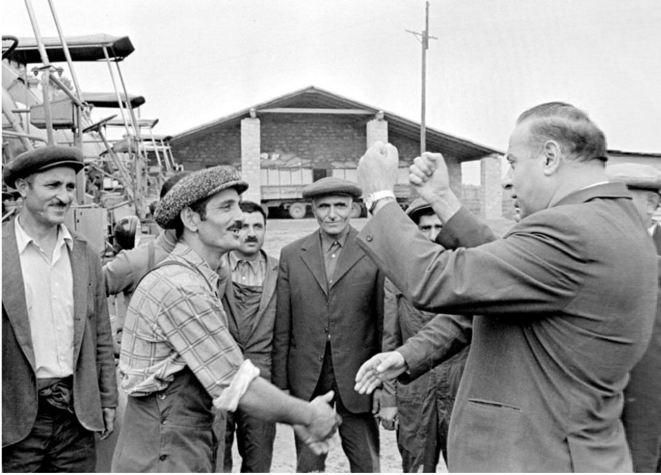
Əvvəli Seh. 9

Tam məsuliyyətlə demək olar ki, elan olunmuş dövlət müstəqilliyini qorumaq və möhkəmləndirmək, ona dönməz və əbədi xarakter vermək üçün olduqca böyük işlərin görülməsi tələb olunur. Müstəqilliyin siyasi - iqtisadi, mənəvi-psixoloji, hərbi-hüquqi, ictimai-siyasi təməli qoyulan ilk illərdə Azərbaycanda hakimiyyətdə olan seriştsizlər mövcud imkanlardan düzgün yararlanma bilmədilər-bir çox mütəxəssislərin apardığı təhlillər göstərdi ki, İttifaqın dağılması ərfəsində keçmiş SSRİ-də bir neçə respublika, o cümlədən Azərbaycan tam müstəqil olaraq öz iqtisadiyyatını idarə edə bilərdi. Hələ sovet dövründə, Ulu öndərin rəhbər olduğu dövrdə respublikamızın tam müstəqil dövlət kimi fəaliyyət göstərməsi üçün möhkəm zəmin yaranmışdır. Çox təəssüf ki, dövlət müstəqilliyinin ilk dövrlərində hakimiyyətdə olan şəxslər dünyanın çox sürətlə dəyişən siyasi mənzərəsini nəzərə almağı bacarmadılar və siyasi liderin sonralar qeyd etdiyi kimi, mövcud geosiyasi vəziyyət yeni strategiyanın formalaşmasını tələb edirdi.