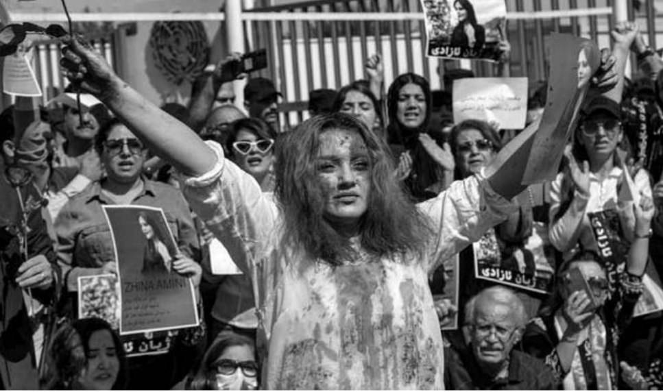
Təbriz isə yenidən inqilab paytaxtına çevrilib