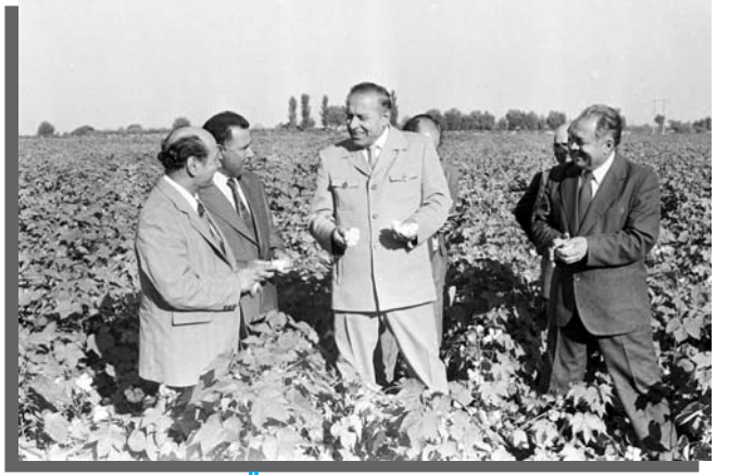
ÜÇLƏR HƏRƏKATI necə yarandı?

Azərbaycan xalqının tarixən rus xalqından üstün təqdim edilməsinə görə işdən çıxarılması, doktorluq dissertasiyasının müdafiəsinə əngəl yaradılması, məhz Heydər Əliyevin göstərişi ilə Rəsul Rza tərəfindən Azərbaycan Sovet Ensiklopediyasında işə düzəlməsi, az sonra yenidən ADPU-dakı əvvəlki işinə qaytarılması və ardıcıl neçə il həmin Ali Məktəbin qəbul komissiyasının məsul katibi təyin edilməsi də danılmaz faktlardır.