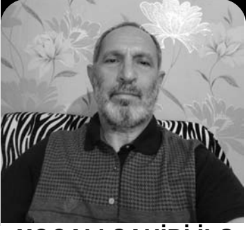
XOCALI ŞAHİDİ İLƏ MÜSAHİBƏ