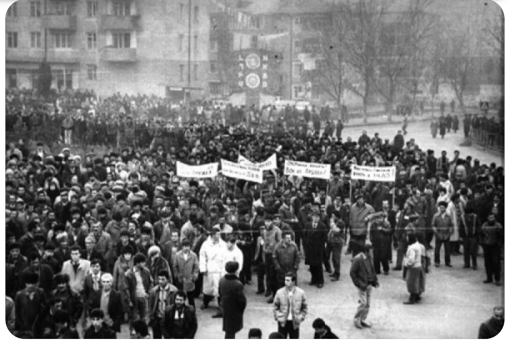
Nazirliyi və Dövlət Təhlükəsizliyi Xidmətinin

Bu cinayətin əsl mahiyyətini açmaq, SSRİ Baş Prokurorluğunun üstündən sükutla keçdiyi məqamları araşdırmaq üçün Azərbaycanın qəti siyasi iradəsinin təzahürü olaraq, Azərbaycan Respublikasının Prezidenti İlham Əliyevin göstərişi və Baş prokurorun qərarı ilə həmin kütləvi iğtişəşlərlə əlaqədar keçmiş SSRİ Baş Prokurorluğu tərəfindən istintaqlar aparılaraq sonradan dayandırılmış beş cinayət işinin icraatı təzənlənərək vahid icraatda birləşdirildi və istintaqın aparılması Baş prokurorun birinci müavininin rəhbərliyi ilə prokurorluq, Daxili İşlər