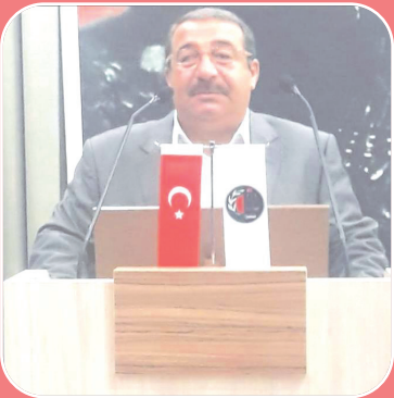
Rahmi Akar deyib.

Onun sözlərinə görə, müharibənin başladığı ilk gündən bu günə qədər Rusiya-Ukrayna arasında olan müharibədən əlavə Avropa ilə Rusiya arasında bir müharibəyə çevrildiyi müşahidə edilir: "Bu da xronikləşmiş bir vəziyyət yaradır. Müharibənin ciddi səviyyədə təhlükəli mərhələyə dönüşəcəyi ilə bağlı ciddi təərəddüdlərimiz var. Bu təərəddüdlərin ortadan qaldırılması üçün xüsusilə Türkiyə ortaq nöqtəni tapmağa çalışsa da, hələ də müsbət bir nəticə əldə olunmayıb".