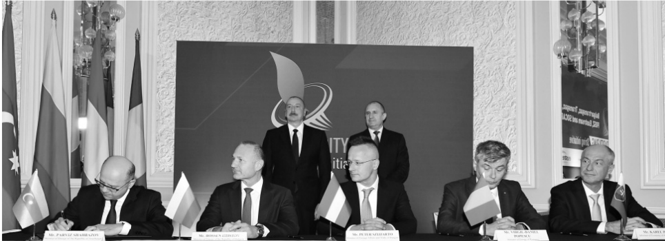
Memorandum of Understanding for encouraging cooperation among Bulgartransgaz, Transgaz, FGSZ, Eustream and SOCAR

bildirmişdir ki, 27 ildən çoxdur ki, etibarlı xam neft tədarükçüsüyük, elektrik enerjisi də bizim ixracımızın bir hissəsidir. "Avropa İttifaqı ölkələrinin üçdə biri Azərbaycanın strateji tərəfdaşdır"- deyən Prezident İlham Əliyev onu da vurğulamışdır ki, bu gün imzalanan Anlaşma Memorandumu Avropanın enerji təhlükəsizliyini gücləndirəcək və Azərbaycanın bir çox Avropa ölkəsinə daha çox qaz ixrac etməsinə imkan verəcək: "Bu gün artıq burada Avropa Komissiyasının enerji komissarı xanım Kadri Simson, eləcə də Avropa Komissiyasının digər rəsmiləri və digər dostlar tərəfindən də qeyd edildiyi kimi, Azərbaycan Avropanın etibarlı tərəfdaşdır və bu sadəcə enerji sahəsində deyil, bir çox digər sahələrdə də belədir. Həmçinin sizə bildirmək istərdim ki, Azərbaycan Avropa İttifaqı üzvü olan 9 ölkə ilə strateji tərəfdaşlıq haqqında razılaşma və bəyannamələr imzalayıb və qəbul edib. Beləliklə, bu o deməkdir ki, Aİ ölkələrinin üçdə biri Azərbay-