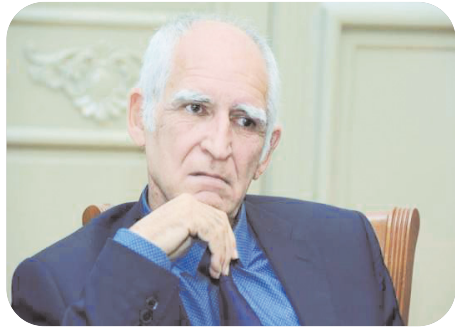
TƏHSİL EKSPERTİ AÇIQLADI

“Birmənalı şəkildə demək olmaz ki, əksər valideynlər qız övladlarına xaricdə təhsilə icazə vermirlər, yaxud da rayonda yaşayanlar qızlarını Bakıya buraxmırlar. Habelə onu da qətiyyətlə iddia etmək olmaz ki, belə hallar bizdə yoxdur. Nəinki, qızlarını təhsil almaq üçün xaricə göndərməyənlər, hətta öz rayonunda, öz kəndində belə qız uşaqlarını təhsildən yayındıran valideynlər kifayət qədərdir.