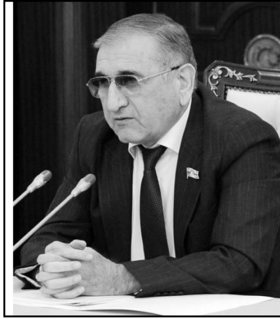
KOMİTƏ SƏDRİ ŞƏRH ETDİ

“Azərbaycan Respublikasının Prezidenti cənab İlham Əliyevin hakimiyyətdə olduğu ilk gündən bu günə kimi etdiyi sülh çağırışları, demokratiya və təhlükəsizliyin təmin olunması sahəsindəki təşəbbüsləri və bunun əməli fəaliyyətdə öz əksini tapması dünyanın bir çox rəhbərləri, beynəlxalq təşkilatları tərəfindən yüksək qiymətləndirilir. Torpaqlarımızın 30 il işğal altında qalmasına, şəhər və kəndlərimizin viran qoyulmasına, erməni təcavüzkarları üzərində tarixi qələbə qazanılmasına baxmayaraq dövlətimizin rəhbəri hər an sülh yolunu tutdu və bu gün də sülhsevər məqsədlərini aydın ifadə edir. Məhz buna görə də cənab İlham Əliyev dünyanın müxtəlif ölkələrində keçirilən sülhməramlı tədbirlərə dəvət olunur və bu tədbirlərdə dünya ölkələrinə sülh mesajlarını ünvanlayır”. Bu sözləri SİA-ya ver-