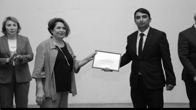
Oğuz rayonunda "Heydər Əliyev İli" çərçivəsində tədbir keçirilib