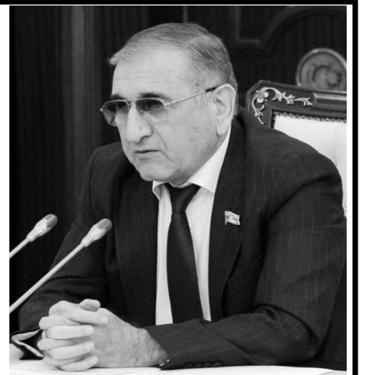
KOMİTƏ SƏDRİ ŞƏRH ETDİ

İndi işğaldan azad olunmuş ərazilərdə Böyük Qayıdış Proqramının uğurla yerinə yetirilməsi, görülən möhtəşəm işlər, Qarabağın və Şərqi Zəngəzurun yenidən qurulması və sakinlərin öz atababa yurdlarına daha tez qayıdışı hər bir azərbaycanlıni ciddi düşündürür. Büdcədən bu məqsədlə nə qədər çox vəsait ayrılsa yene də azdır. Çünki tikinti-abadlıq-bərpa işlərinin həcmi çox