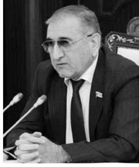
KOMİTƏ SƏDRİ ŞƏRH ETDİ