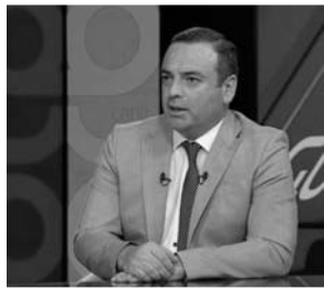
POLİTOLOQ ŞƏRH ETDİ

kilərin çox böyük qismi - təxminən 40%-i taxıl və dənli bitkilərlə bağlı ciddi problemlə üzləşməyən Avropa bazarlarına, ciddi ərzaq problemi yaşayan Afrika qitəsinə isə cəmi 12%-i daşınıb. Əslində Türkiyə prezidenti Rəcəb Tayyib Ərdoğanın birbaşa təşəbbüsü və vasitəçiliyi ilə əldə olunmuş bu razılaşmanın başlıca mahiyyəti dünya bazarında ərzaq qiymətlərinin və taxıl məhsullarının qiymətlərinin artımının qarşısını almaq, eyni zamanda bir sıra bölgələrdə, xüsusilə Afrika kimi inkişafdan geri qalmış yerlərdə insanların qida təhlükəsizliyi, ərzaq problemləri ilə üzvləşməsi üçün belə razılaşma əldə olunub. Lakin razılaşmanın mühüm şərtlərinə elə ilkin dövrdən Avropa dövlətləri - güclü dövlətlər pozmağa çalışırdılar və