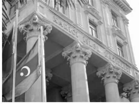
Məlumatda deyilir: "Bununla yanaşı, BMT TŞ üzvlərinin əksəriyyətinin vurğuladığı kimi, bölgədə sülh və sabitliyin bərqə-

Azərbaycan XİN Paşinyanın BMT Təhlükəsizlik Şurasında aparılmış müzakirələri təhrif etməsinə münasibət bildirib