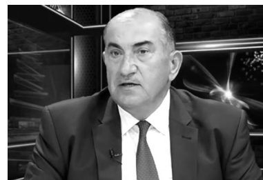
POLİTOLOQ ŞƏRH ETDİ

Politoloq sözlərinə davam edərək bildirdi ki, müharibədən sonra da Azərbaycan uğurlu siyasəti nəticəsində qələbələr qazanır: "Xüsusilə də, BMT TŞ-da