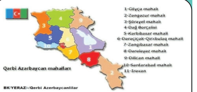
Qərbi Azərbaycan mahalları