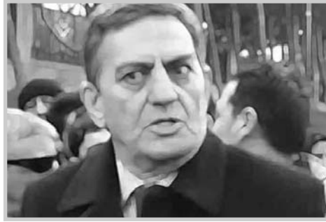
Əksinə, anormal əməllərini daha geniş və həyasız formada davam etdirirlər.