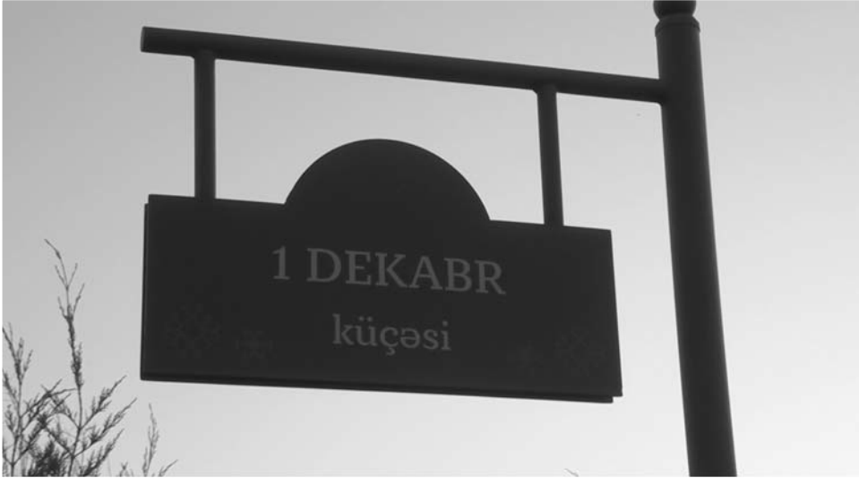
Əvvəli Səh. 5

Elə "1 Dekabr" küçəsinin girişindəki evdə yaşayan İpek nənə də vaxtilə böyüyüb boya-başa çatdığı həmin evə qayıdandı. Biz heyətə daxil olanda İpek nənə oğlunun əkdüyü gülləri sulamaqla məşğul idi. Adı kimi özü də İpek nənə bizi elə mehriban və səmimi şəkildə qarşıladı ki, sanki illərdi bir evin adamıyıq. 45 yaşında Laçını tərk etmək məcburiyyətində qalan nənəmiz Vətəninə qayıtdığı üçün çox sevincli olduğunu bildirdi: "Bakı da bizim yerimiz-yurdumuzdur, amma Laçın Vətənimizdir. 30 il əvvəl çıxdığım ev indi bizə təmir olunaraq geri qaytarılıb. O vaxt 4 su-bay övladımın buranı tərk etməyə məcbur qalmışdım. İndi isə oğlum, gəlinim, nəvələrimlə geri dönmüşəm. Oğlum yaşllaşdırma müəssisəsində, gəlinim isə məktəbdə müəllimə işləyir". Hələki Bakıda yaşayan digər iki oğlunun da təzəlikcə Laçına səfər etdiyini və oradan ayrılıb getmək istəmədiklərini deyən İpek nənə bizi çay içməyə dəvət etsə də, görməli olduğumuz yer çox, vaxtımız isə az olduğundan təklifini qəbul edə bilmədik. Yeri gəlmişkən, İpek nənənin heyətində insanı möhtəşəm mənzərə qarşılayır. Hər gün belə gözəl mənzərə ilə qarşılaşan insanın ruhu da cavan qalar. Elə İpek nənə kimi.