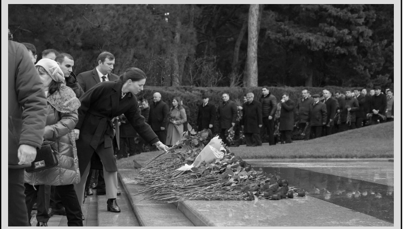
Fəxri Xiyabana ziyarət

Həmin o sərsəm "Ayakve" təşəbbüsü nə etmək niyyətindədir? Birbaşa erməni dövlətçiliyinə hücum etməkdən başqa nəyə hesablanıb bu təşəbbüs?