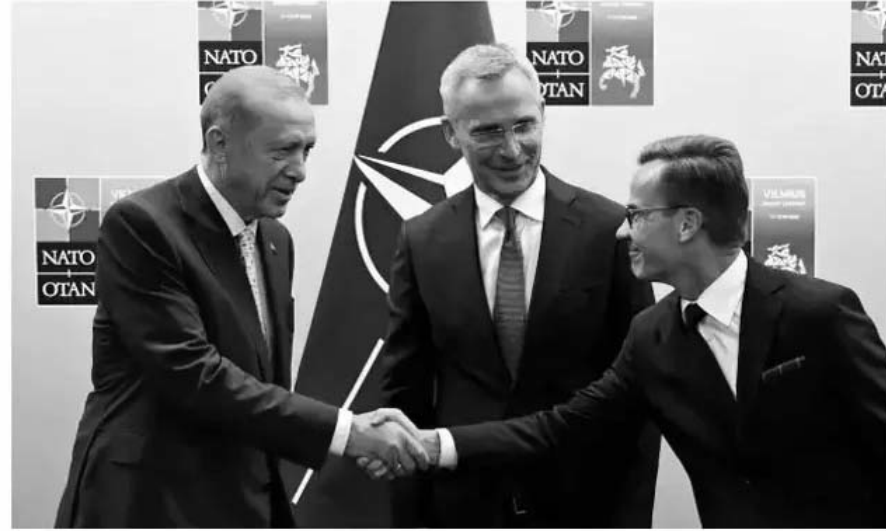
At a Nato summit in Lithuania in July, the Turkish president, Recep Tayyip Erdoğan (left), shakes hands with the Swedish prime minister, Ulf Kristersson, as the secretary general of Nato, Jens Stoltenberg, looks on.

The Turkish parliament has given its long-awaited approval to Sweden's