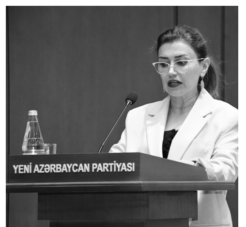
nəfər nümayəndənin seçilməsi barədə qərar qəbul edilib.