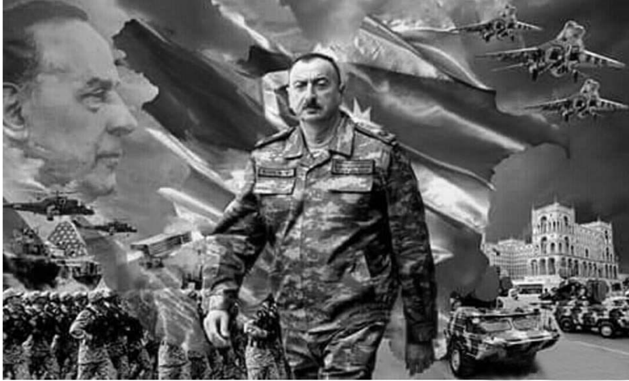
Əvvəli Səh. 9