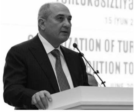
Əvvəli səh. 4

YAP Sədrinin müavini diqqətə çatdırıb ki, Ümummilli Liderin siyasi varisi - Azərbaycan Respublikasının Prezidenti cənab İlham Əliyevin milli maraqlara əsaslanan, müasir dövrün reallıqları və çağırışlarına cavab verən çoxşaxəli siyasətində türk dövlətləri ilə ortaq mənəvi dəyərlərə və müştərək strateji maraqlara əsaslanan münasibətlərin inkişafı xüsusi yer tutur: "Dövlət başçısı Türk dünyasında əməkdaşlığın dərinləşdirilməsinə, xüsusilə də Türk Dövlətləri Təşkilatının gücləndirilməsinə