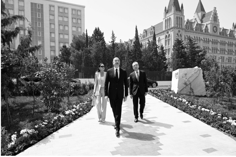
Prezident İlham Əliyev və birinci xanım Mehriban Əliyeva Bakıda Botanika İnstitutunun yeni binasının açılışında iştirak edib və Nəbatat Bağında görülən işlərlə tanış olublar