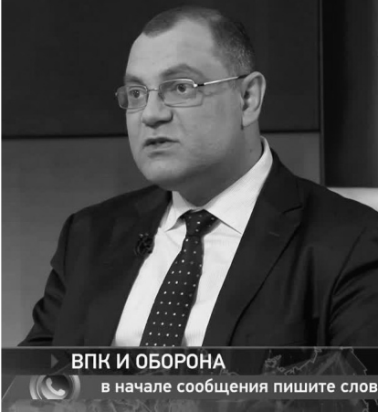
ВПК И ОБОРОНА в начале сообщения пишите слово

Və təbii ki, ABŞ Cənubi Qafqazda sülhün bərqərar olmasında maraqlı deyil. ABŞ-da sülh sazişinin imzalanmasına ondan öz maraqları naminə istifadə etmək imkanı kimi baxırlar. Siz görürsünüz ki, ABŞ Ermənistan-Azərbaycan nizamlanmasında necə ikili oyun oynayır. Bir an Azərbaycanı tənqid edir, bir anda