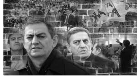
Tom Lantos Əli Kərimliyə məktub göndərib

Yayılan məlumatlar təsdiq edir ki, Ə.Kərimli və C.Həsəni seçki məsələsini ermənipərəst dairələrlə müzakirə edib və sonda yekdil nəticəyə gəliblər. Nəzərə almaq lazımdır ki, Qərbin və Avropanın məkrli dairələri Əli Kərimlini və Cəmil Həsəni özlərinin Bakıdakı təmsilçisi hesab edirlər. Dağıdıcı ünsürlərə tapşırıqları və göstərişləri yalnız bu məxluqlar üzərindən həyata keçirirlər. Səbəbsiz yerə deyil ki, ABŞ Konqresmeni Kristofer Smit, ABŞ İnsan Hüquqları Komissiyasının sədri Tom Lantos, Nümayəndələr Palatasının üzvü, Komissiyanın həmsədri Chris Smith və digərləri Əli Kərimli ilə məktubləşir, onunla təxribatları hansı formada həyata keçirmək yollarını müzakirə edirlər. Bu baxımdan birmənalı şəkildə demək olar ki, Əli Kərimli dağıdıcı müxalifətin başbileni olmasa da, xarici maraqlı dairələrin Bakıda əsas dayağıdır. Hər iki tərəfi eyni maraqlar birləşdirir. Birincilər qərar almağa çalışırlarsa, ikincilər də Azərbaycanın dünya miqyasında artan nüfuzuna xələl gətirilməsinə çalışırlar. Bu baxımdan demək olar ki, Ə.Kərimlini və C.Həsəni danışırdan xarici məkrli dairələrin maliyyə yardımlarıdır.