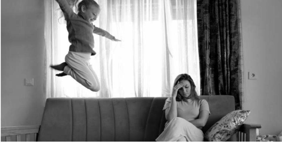
Əvvəli səh. 10