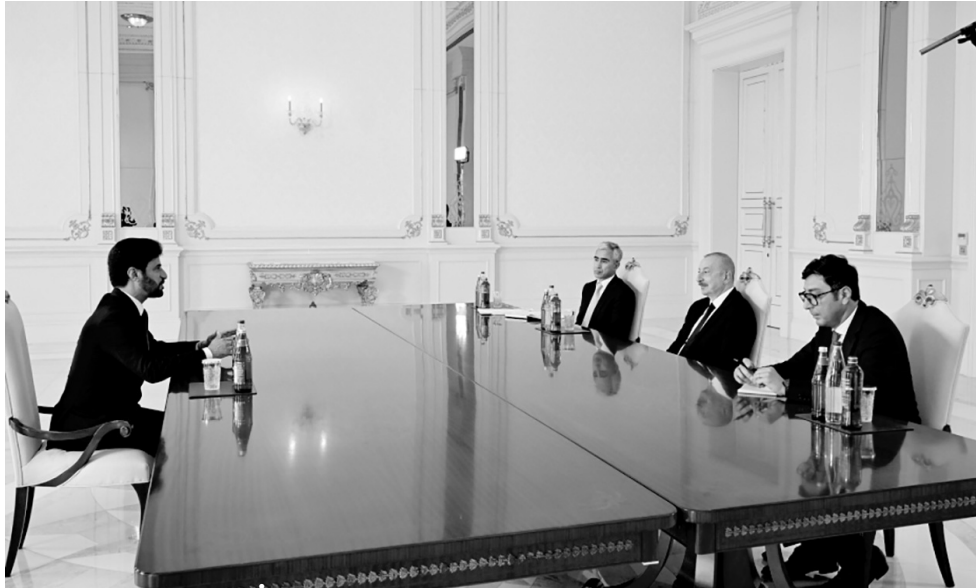
Prezident İlham Əliyev Beynəlxalq Avtomobil Federasiyasının prezidentini qəbul edib

Azərbaycan Respublikasının Prezidenti İlham Əliyev sentyabrın 15-də Beynəlxalq Avtomobil Federasiyasının prezidenti Məhəmməd Ben Sulayemə qəbul edib. AZƏRTAC xəbər verir ki, Məhəmməd Ben Sulayem ötən ilin dekabrında Beynəlxalq Avtomobil Federasiyasının Baş Assambleyasının və Federasiyanın mükafatlandırma mərasiminin Bakıda keçirilməsinə verdiyi dəstəyə görə dövlətimizin başçısına minnətdarlığını bildirdi. Qonaq Azərbaycan Avtomobil