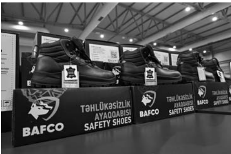
Əvvəli səh. 2