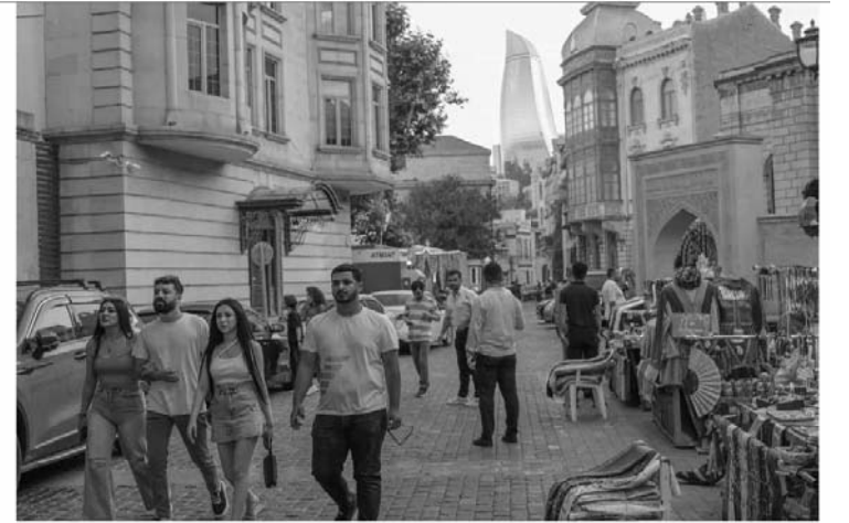
The Old City with Flame Tower in the background, Baku, Azerbaijan, June 20, 2024.

H ər bir insanın yaşadığı dünyanın gözəlliyindən həzz almaq hüququ var və turizm sənayesi insanlara bu imkanı verir. 27 sentyabr Ümumdünya Turizm Günü səyahətçilərin, turistlərin və bu sektorda çalışanların bayramıdır. Bu gün dünyanın 150-dən çox ölkəsində, o cümlədən ölkəmizdə də qeyd olunur. Birləşmiş Millətlər Təşkilatının Ümumdünya Turizm Təşkilatı tərəfindən müəyyən edilən Ümumdünya Turizm Günü, turizmin beynəlxalq ictimaiyyət üçün əhəmiyyətini vurğulamaq və maarifləndirmək məqsədilə 1980-ci ildən etibarən qeyd edilir.