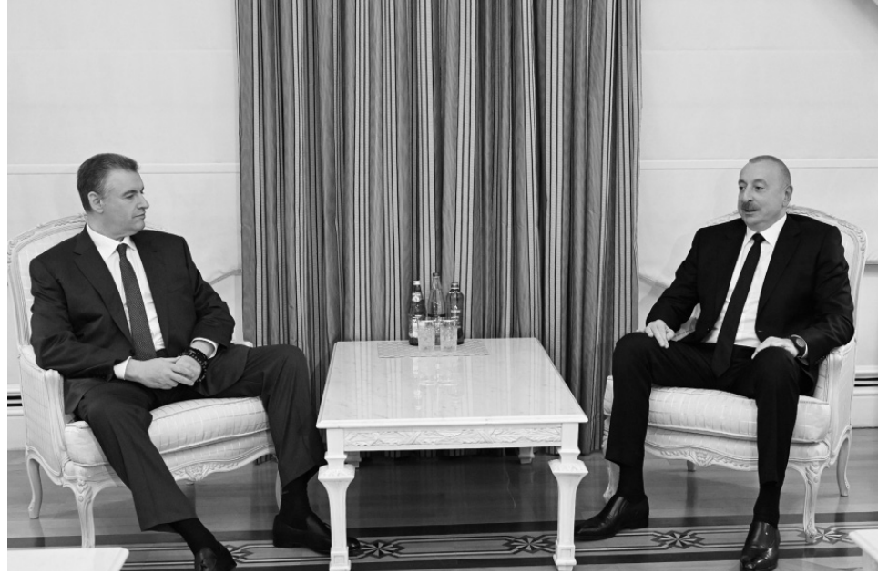
Prezident İlham Əliyev Rusiya Dövlət Dumasında Rusiya Liberal Demokrat Partiyası fraksiyasının rəhbərini qəbul edib

ri köçkünlər də Qarabağ bölgəsinə səfər etməklə bağlı qərarınızı layiqincə qiymətləndirəcəklər. Bir daha xoş gəlmisiniz."