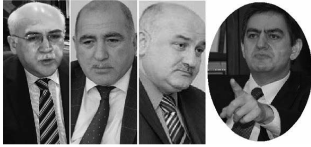
rabağ problemi həllini tapsın.

İsa Qəmbər, Əli Kərimli, Arif Hacı, Pənah Hüseyn bu günə qədər çıxıb etdikləri bəd əməllərə, yanlış siyasətə görə xalqdan üzr istəməyiblər