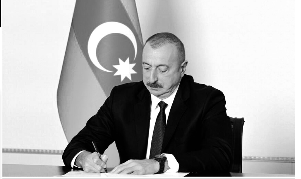
Prezident İlham Əliyevin Sərəncamı əsasında Bakı şəhərində və ətraf ərazilərdə nəqliyyat infrastrukturunu təkmilləşdiriləcək

inkışafın sürətləndirilməsini və insanların həyat keyfiyyətinin artırılmasını hədəfləyir. Dövlət Proqramı əhaliyə keyfiyyətli nəqliyyat xidmətləri göstərilməsi, ərazinin perspektiv inkişafı nəzərə alınmaqla yol hərəkətinin bütün iştirakçılarının təhlükəsizliyinin təmin edilməsi, ümumi istifadədə olan nəqliyyat xidmətlərinin keyfiyyətinin, dayanıqlılığının və əlçatanlığının artırılması, həmçinin fərdi mobil nəqliyyat vasitələrinin, nəqliyyat və piyada infrastrukturundan istifadənin müasir tələblərə cavab verən səviyyədə təmin edilməsi və nəqliyyatda rəqəmsal texnologiyaların tətbiqi prinsipləri əsasında hazırlanmışdır. Məqsəd nəqliyyat sisteminin təkmilləşdirilməsi nəzərdə tutulan Bakı şəhərində və ətraf ərazilərdə dayanıqlı nəqliyyat sisteminin qurulması, sərnişin mobilliyinin keyfiyyətinin artırılması və yol-nəqliyyat hadisə-