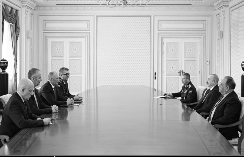
Prezident İlham Əliyev Bosniya və Herseqovinanın Nazirlər Şurası sədrinin müavini qəbul edib