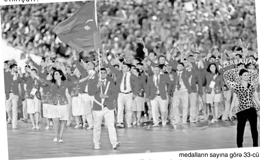
medalların sayına görə 33-cü pillədə qərarlaşıb.

Son illər ölkə iqtisadiyyatının sürətli inkişafı bədən tərbiyəsi və idmanı da əhatə etmişdir.