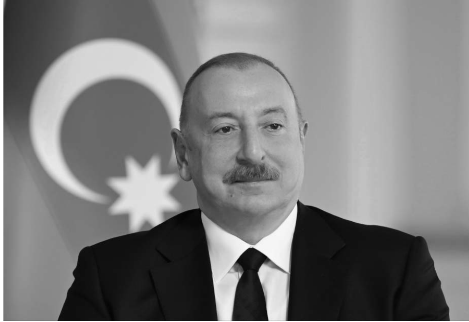
Müsahibədə Türk Dövlətləri Təşkilatının TDT-nin Azərbaycan və Qazaxıstan üçün rolu xüsusi qeyd olunur. Prezident Əliyev təkcə siyasi platforma deyil, həm də türk

dünyasının mədəni və elmi inteqrasiyasını təmin edən strateji mexanizm olduğunu vurğulayır. Qəbələ və Şuşada keçirilən zirvə görüşlərinin, eləcə də Beynəlxalq Türk Akademiyasının fəaliyyətinin Türk dünyasının birliyini möhkəmləndirdiyi bildirilir.