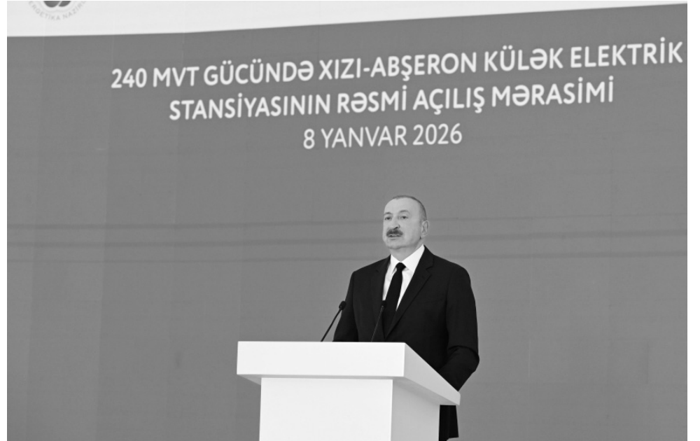
240 MVT GÜCÜNDƏ XIZI-ABŞERON KÜLƏK ELEKTRİK STANSİYASININ RƏSMİ AÇILIŞ MƏRASİMİ 8 YANVAR 2026

Yanvarın 8-də Bakıda, “Gülüstan” sarayında Səudiyyə Ərəbistanı Krallığının “ACWA Power” şirkəti tərəfindən inşa edilmiş 240 MVT gücündə “Xızı-Abşeron” Külək Elektrik Stansiyasının rəsmi açılış mərasimi keçirilib.