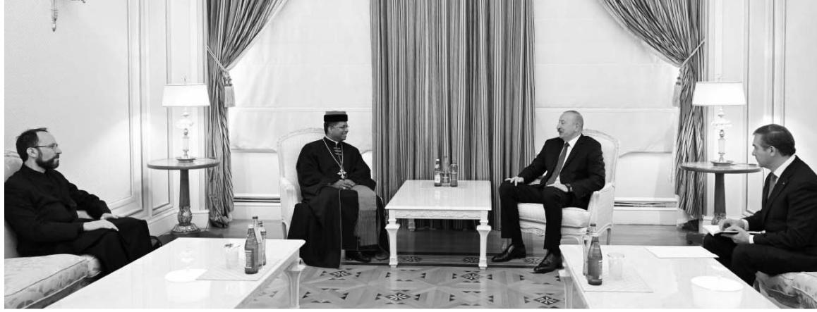
Leonun və Vatikanın dövlət katibi kardinal Pietro Parolinin salamlarını dövlətimizin başçısına çatdırdı.

A zərbaycan Prezidenti İlham Əliyev iyunun 16-da Müqəddəs Taxt-Tacın Dinlərarası Dialoq üzrə Dikasteriyasının prefektini Corc Ceykob Kuvakadı qəbul edib. Söhbət zamanı ölkəmizlə Müqəddəs Taxt-Tac arasında münasibətlərin uğurla inkişaf etdiyi vurğulandı, müxtəlif səviyyəli qarşılıqlı səfərlərin ikitərəfli əlaqələrimizin inkişafında roluna toxuldu. Bu baxımdan Corc Ceykob Kuvakadın ölkəmizin regionlarına da səfər edəcəyinin əhəmiyyəti qeyd olundu. Qəbula və göstərilən qonaqpərvərliyə görə minnətdarlığını bildiren Müqəddəs Taxt-Tacın Dinlərarası Dialoq üzrə Dikasteriyasının prefektini Roma Papası XIV